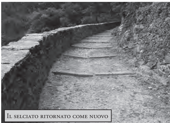
IL SELCIATO RITORNATO COME NUOVO

Considerata la situazione e vista l'importanza che questo collegamento ha sempre avuto per raggiungere i monti di