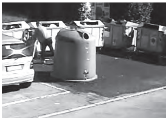
DUE IMMAGINI DI VIOLAZIONI NELLA RACCOLTA RIFIUTI REGistrate DALL'IMPIANTO MOBILE DI VIDEOSORVEGLIANZA