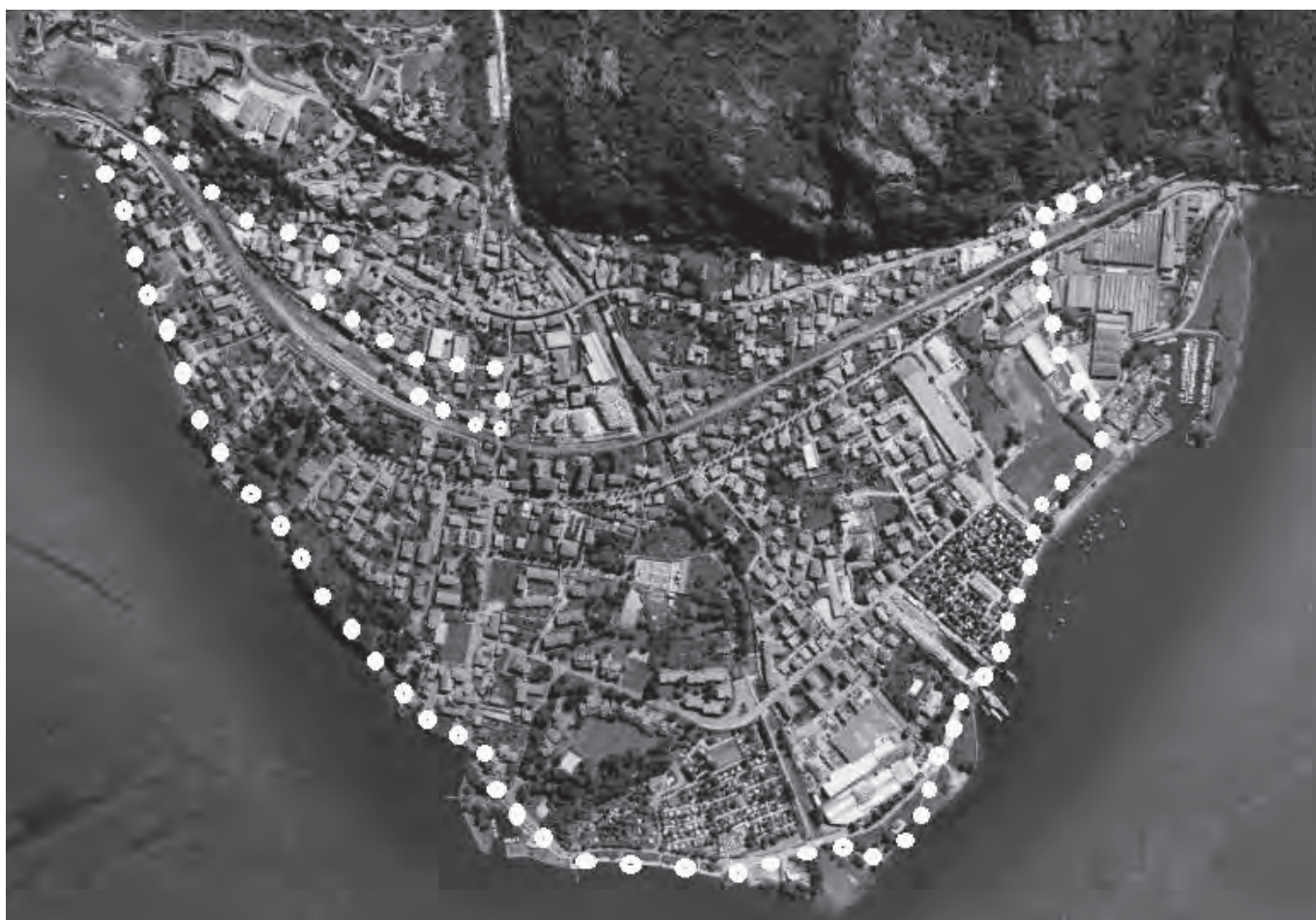
IL TRACCIATO DELLA PISTA CICLOPEDONALE DA UN CAPO ALL'ALTRO DEL PAESE

alla legge regionale n. 7 del 2009 dal titolo "Interventi per favorire lo sviluppo della mobilità ciclistica" che intende perseguire obiettivi di intermodalità e di migliore fruizione del territorio e garantire lo sviluppo in sicurezza dell'uso della bicicletta. L'Autorità di bacino del Lario ha invece erogato il proprio contributo per la parte che verrà realizzata su territorio demaniale. Entrambi i contributi sono finalizzati esclusivamente a questo tipo di intervento e permetteranno, con una spesa davvero limitata per le casse comunali, di offrire ai cittadini una nuova infrastruttura per fruire di tutto il lungolago e riscoprire gli scorci migliori del nostro territorio, per fare sport, passeggiare e tenersi in forma, per spostarsi in sicurezza e per incrementare l'utilizzo della bicicletta.