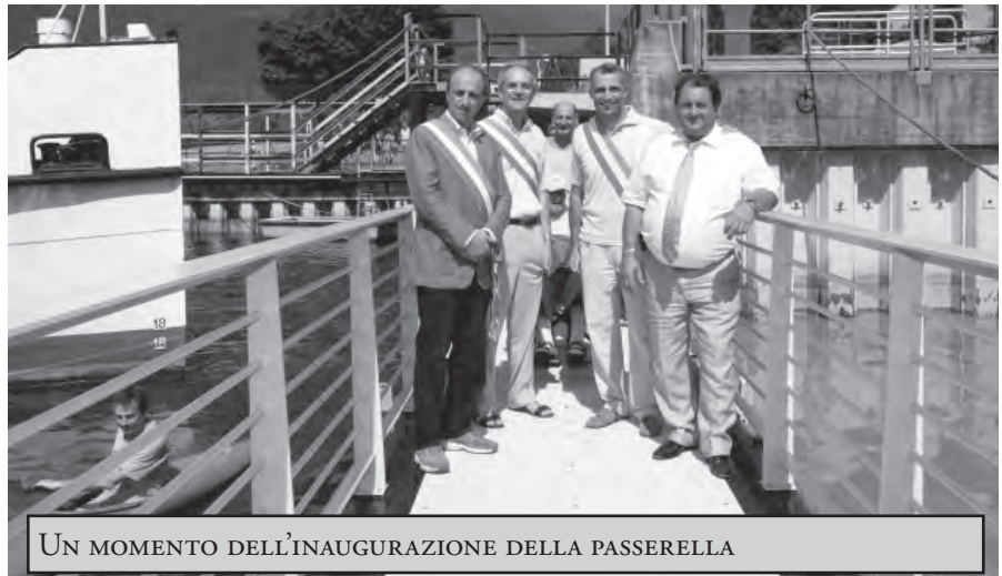
UN MOMENTO DELL'INAUGURAZIONE DELLA PASSERELLA

Oltre che per questi eventi, e per molti altri non citati ma certo non meno importanti, l'estate è stata caratterizzata dagli interventi che hanno reso fruibili importanti strutture a disposizione di tutti i cittadini. Ha raccolto unanimi commenti positivi l'apertura della nuova passerella che collega senza interruzioni la passeggiata sul lungolago, attraversando l'area del cantiere della Navigazione Laghi. È stata inoltre velocemente ripristinata anche la strada che porta a Pianezzo e agli altri nuclei rurali soprastanti il paese, salvando anche la stagione estiva degli appassionati dei nostri monti e dei proprietari delle decine di baite sparse nei vari nuclei rurali. L'estate 2013 è sicuramente finita in crescendo!