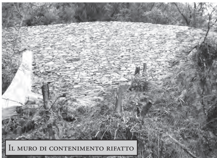
IL MURO DI CONTENIMENTO RIFATTO

L'Amministrazione Comunale, vista l'importanza di questa strada per il paese, si è quindi assunta la responsabilità di attivare immediatamente i lavori utilizzando le procedure di emergenza previste dalla legge, senza attendere la sicurezza della loro copertura finanziaria: secondo le normali procedure che disciplinano le opere pubbliche, avremmo dovuto attendere il finanziamento ma sarebbero passati dei mesi preziosi che rischiavano di privare per lungo tempo i Derviesi di questo collegamento molto utilizzato per raggiungere le baite sui monti. Grazie all'efficienza del Comune e all'impegno della ditta esecutrice dei lavori, la strada è ritornata invece esattamente come prima, in un tempo davvero molto limitato.